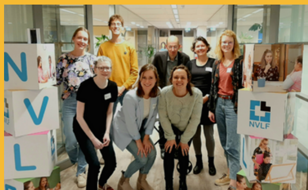
Klankbordgroep bijeenkomst op het NVLF kantoor in Woerden (beroepsvereniging logopedie)