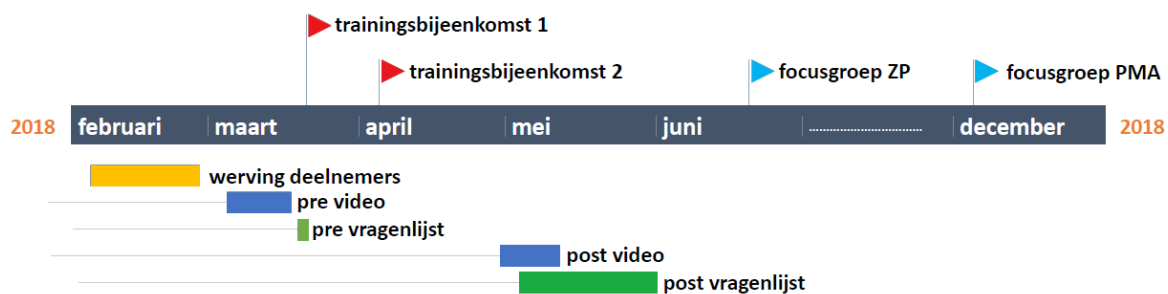
Figuur 1. Tijdpad van de studie met weergave van moment van de beide trainingsbijeenkomsten en beide focusgroepen en periode van werving, pre en post video-opnames, pre en post afname vragenlijst.