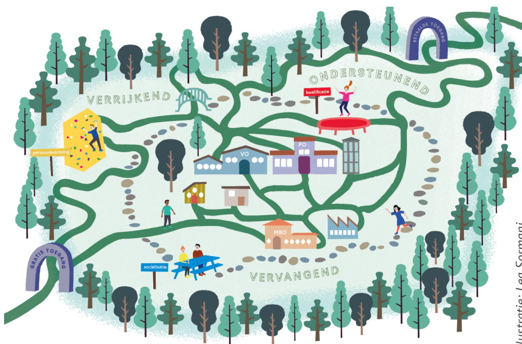
Illustratie: Lea Sormani

2 Elffers, L., Fukkink, R., Jansen, D., Helms, R., Timmerman, G., Fix, M. & Lusse, M. (2018). Aanvullend onderwijs: leren en ontwikkelen naast de school. Een verkennende schets van het landschap van aanvullend onderwijs in Nederland . Amsterdam: NWA.