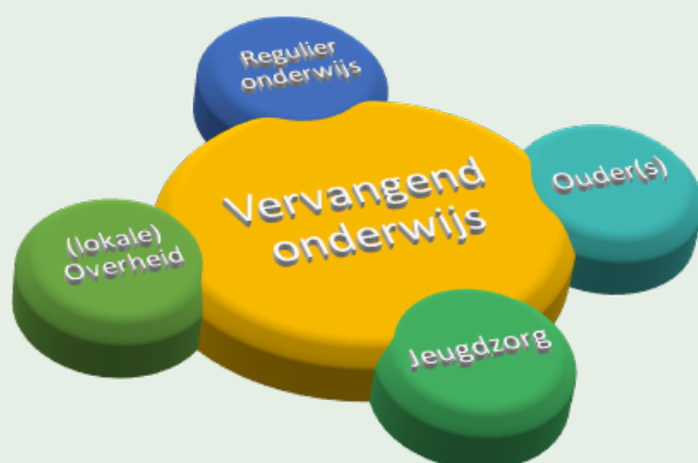
Figuur 2: Vervangend onderwijs in de context van het mbo en mogelijke betrokken partijen

Positionering van de vervangende programma's ten opzichte van het reguliere mbo-onderwijs heeft onder andere te maken met de doelstellingen en uitgangspunten van het initiatief. Vervangend onderwijs dat tot doel heeft dat de jongere weer terug gaat naar het mbo en een startkwalificatie haalt, werkt nauw samen met het reguliere onderwijs. Docenten van het mbo zijn bijvoorbeeld in nauw contact met het vervangende onderwijs en stimuleren mbo-studenten om een vervangend programma te gaan volgen, zij geven soms ook lessen, workshops of trainingen op de locatie van het vervangende programma. Soms worden de programma's ontwikkeld in samenwerking met mbo-scholen om als vangnet te dienen voor de jongeren van die instellingen. In de praktijk is er ook afstemming met de lokale overheid met name als de jongeren leerplichtig zijn. Omdat er vaak sprake is van meervoudige problematiek wordt er waar nodig samengewerkt met partners uit de gezondheids- en welzijnssectoren, lokale jeugdwerkers, de verslavingszorg, de GGZ schuldhulpverlening, vluchtelingenwerk, reclassering, maatschappelijk werk et cetera.